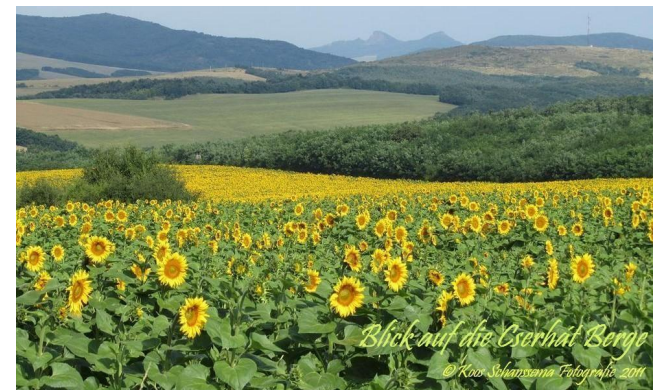
Blick auf die Oserhat Berge

Das Klima ist ähnlich wie Süd / Zentral Frankreich, von Ende März bis Mitte Oktober ist gewöhnlich gutes Wetter für Camping. Die Temperaturen sind in dieser Zeit über 20°C, mit im Juli und August Spitzen von 37°C. Mit viel Sonnenschein und wenig Regen ist es schönes Wetter für Urlaub im Freien. Ungarn ist sicherlich das Frankreich des Mitteleuropa. Weniger bekannt, aber viel billiger.