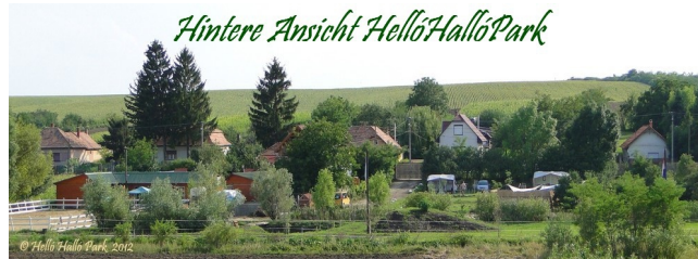
Hintere Ansicht HellóHallóPark