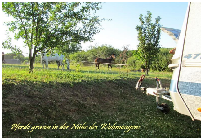
Pferde grasen in der Nähe des Wohnwagens

Es gibt drei Trampoline, ein Kühlbecken, zwei Fußballtore, Basketballanlage, eine Gokart, viele Spiele, ein Kinderspielhaus mit Sandkasten, einem Angelsee, Angelruten zum Angeln, eine große Feuerstelle, Wanderwege mit Sitzbänken, Obst im Überfluss (kostenlos Obst pflücken für unsere Gäste), Nussbäumen, eine gemütliche Terrasse mit Satellit-TV, viele Tiere, usw., usw. In der 1e Badehaus gibt es Fußbodenheizung (gut für die Nebensaison) und im 2e Badehaus ist ein behinderten Raum mit einem Hoch WC.