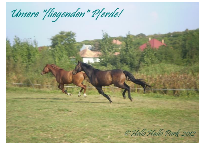
Unsere "fliegenden" Pferde!