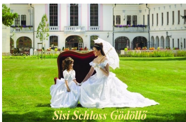
Ski Schloss Gödöllő

Die holländischen Eigentümer von HellóHallóPark , bieten Ihnen die Möglichkeit, einen unvergesslichen Urlaub zu genießen