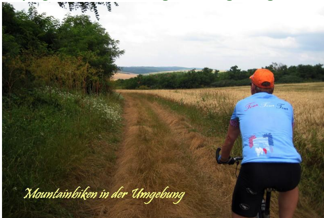
Mountainbiken in der Umgebung

Auf 724 Autokilometer von München ist die Camping und Reitschule HellóHallóPark am Rande des freundlichen ungarischen Dorf Erdőtarcsa . 57 km von Zentrum Budapest und 300 km von Wien entfernt, am Fuße des Cserhát- (729m) und der Mátra-Gebirge (1014m), ist es ein idealer Ausgangspunkt für Aktivitäten wie Fahrradtouren , Wanderungen , Reiten und andere Ausflüge . Die ruhige Umgebung von